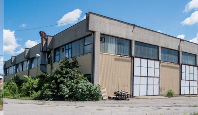
2 HALA 2 FABRIKA FIM HALL 2 FACTORY FIM