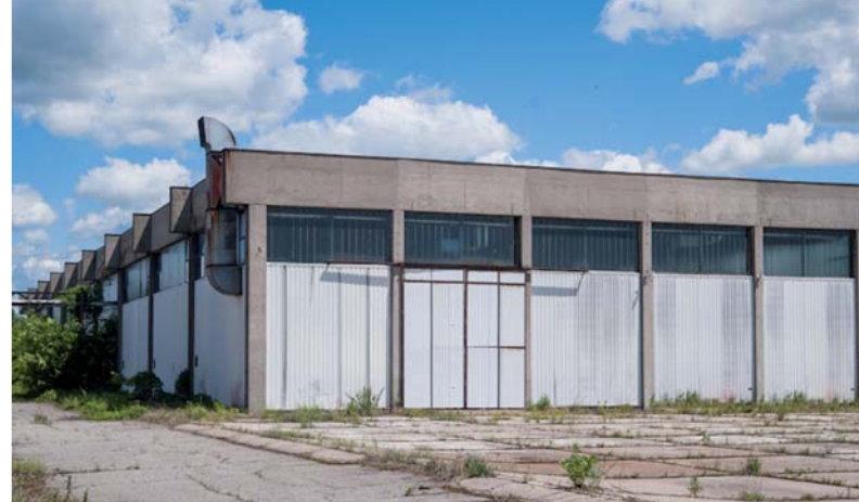
3 HALA 3 | HALL 3