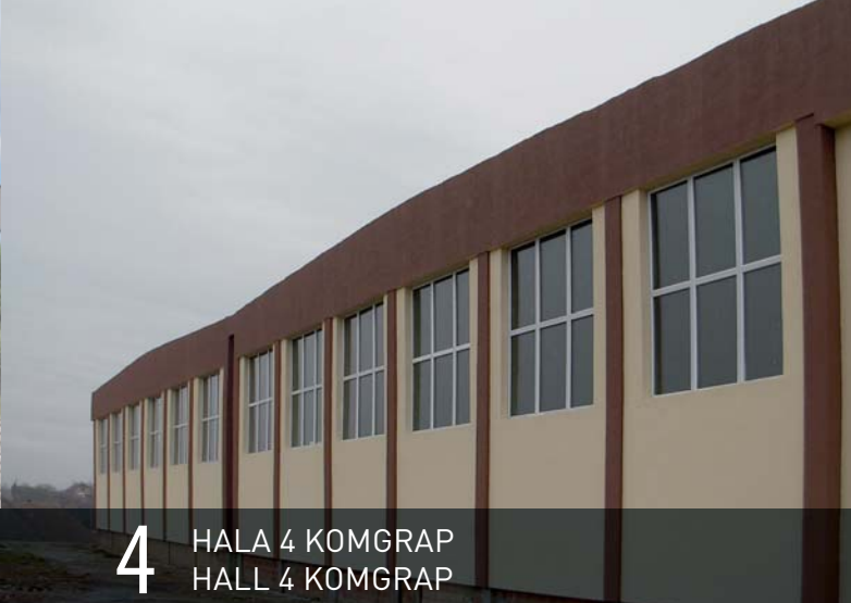
4 HALA 4 KOMGRAP HALL 4 KOMGRAP