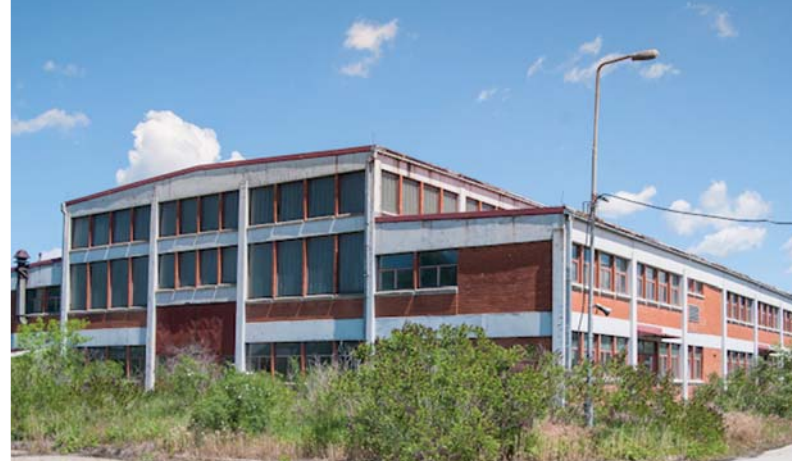
1 HALA 1 I PRATEĆE PROSTORIJE HALL 1 AND SUPPORTING FACILITIES